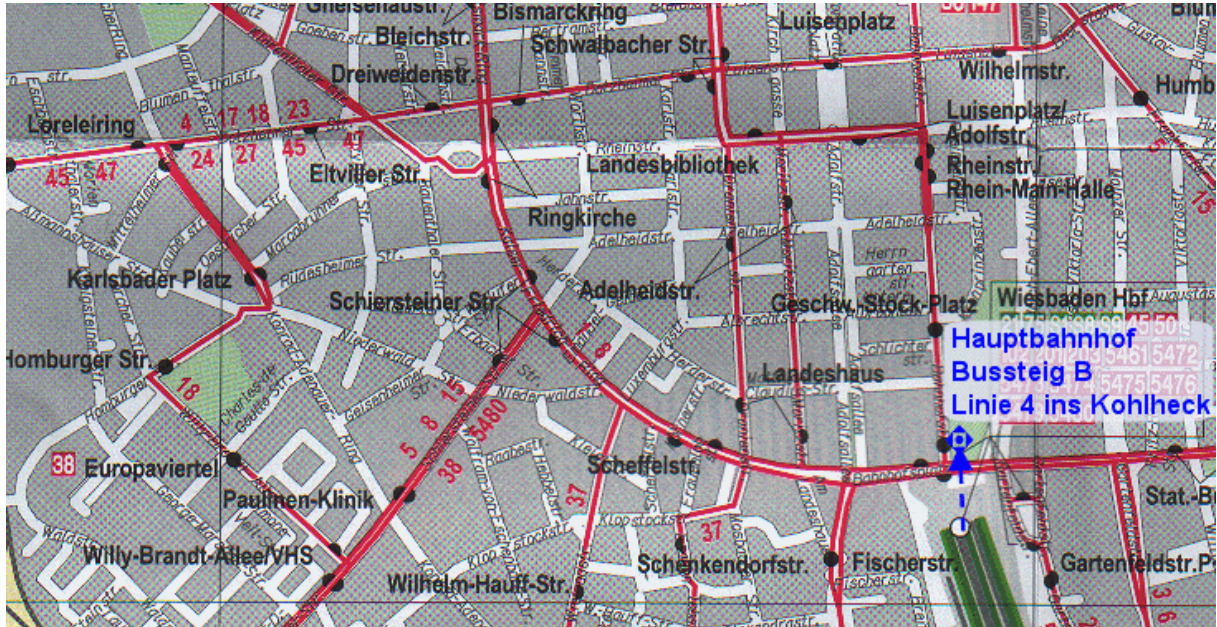
Busplan Haltestelle Bahnhof

Von den Gleisköpfen praktisch weiter in Zugfahrtrichtung vorne aus dem Haupteingang des Bahnhofs hinausgehen (nicht die Seitenausgänge rechts oder links nehmen), weiter vor zur Straße, mit Hilfe der Ampel die Straße geradeaus überqueren und weiter vorwärts direkt zur Bushaltestelle gehen, dabei rechts halten (= Bussteig B). Von dort den Stadtbus Linie 4 Richtung Kohlheck nehmen und durch die Stadtmitte bis raus ins Kohlheck durchfahren.